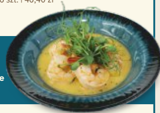
Krewetki w winie i maśle

KREWETKI W WINIE I MAŚLE | 6 szt. | 46,40 zł czosnek, wino, masło, natka Shrimp in wine and butter