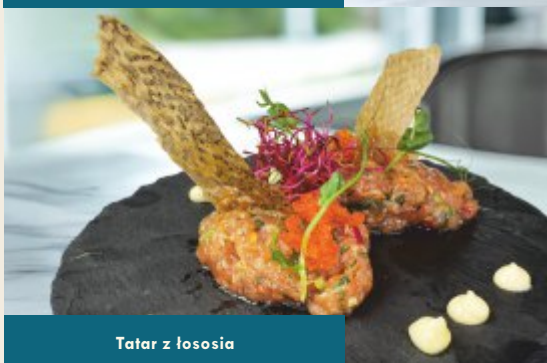
Tatar z łososia