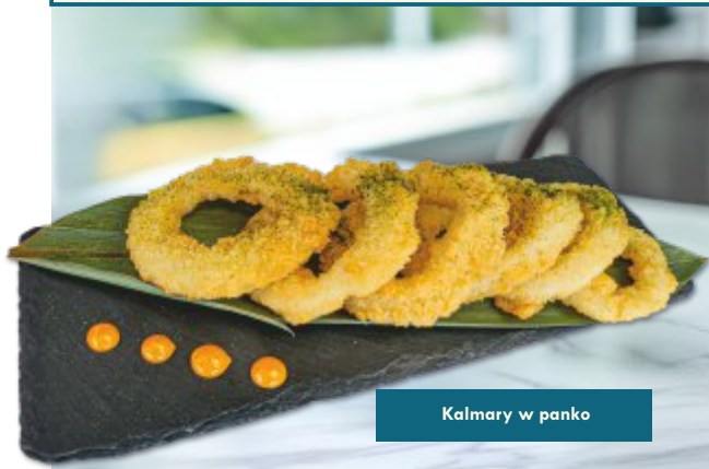
Kalmary w panko

STRIPSY Z KURCZAKA | 100 g | 26,50 zł frytki, surówka z marchewki Chicken strips, fries, carrot salad