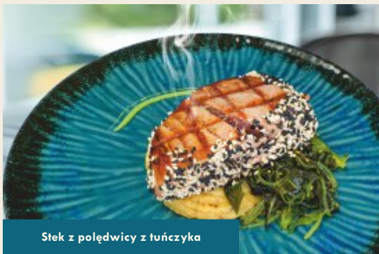
Stek z połówicy z tuńczyka