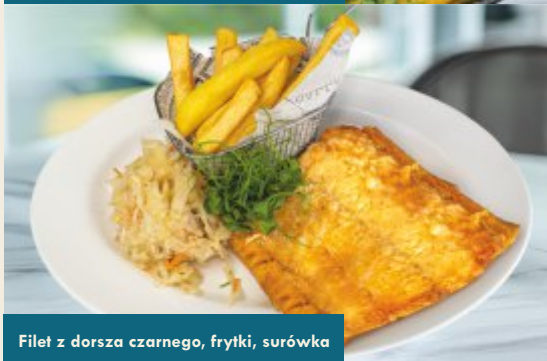
Filet z dorsza czarnego, frytki, surówka