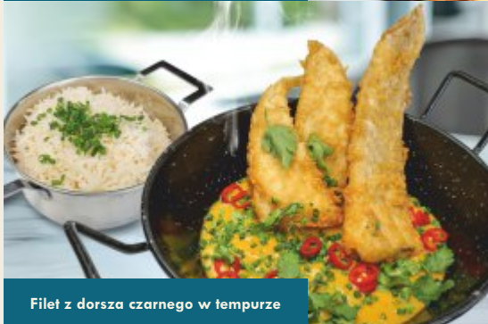
Filet z dorsza czarnego w tempurze