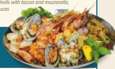
Plater owoców morza

PLATER OWOCÓW MORZA | 500 g | 190,00 zł ryba sezonowa, chipsy z flądry, szprotki, krewetki w tempurze, krewetki w maśle, muszle z boczkiem i mozzarella, warzywa w tempurze, 2 sosy Seafood platter, seasonal fish, flounder chips, sprats, shrimps in tempura, butter prawns, shells with bacon and mozzarella, vegetables in tempura, 2 sauces