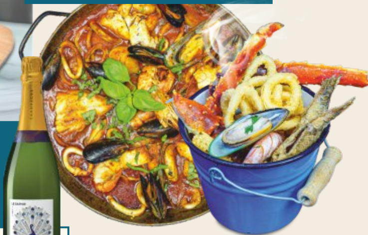
Kubek owoców morza

Region: Champagne Winiarnia: Claude Baron Typ: Wino musujące Odmiana winogron: Chardonnay, Pinot Noir, Pinot Meunier